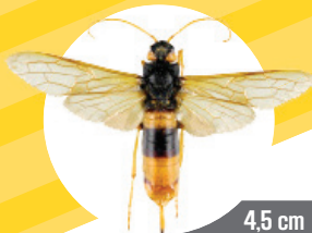
4,5 cm Syrex géant Inoffensif avec de longues antennes