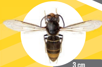
3 cm Frelon Asiatique

Corps brun noir, une partie de l'abdomen orangée, face orangée et bouts des pattes jaunes.