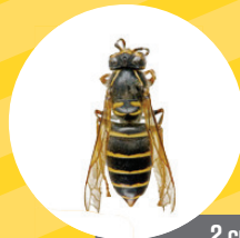
2 cm Guêpe des Buissons Petite et sombre

Placé dans les arbres entre 5 et 30 m d' hauteur.