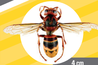
4 cm Frelon Européen

Tacheté de roux, de noir et de jaune vif, abdomen jaune rayé de noir.